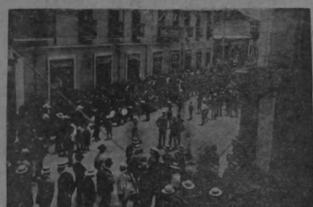
Concurrencia en la calle frente al Palacio Nacional al inaugurar antier sus sesiones el Congreso Constitucional